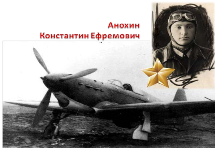
Анохин Константин Ефремович