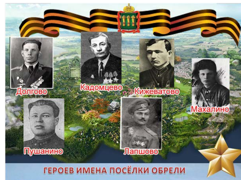
ГЕРОЕВ ИМЕНА ПОСЁЛКИ ОБРЕЛИ

Данная информация может входить в общий раздел презентации «Герои Родины – наши земляки».